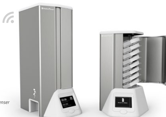
Medimi® Smart tablett dispenser